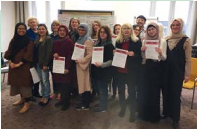
In- Gang- Setzerinnen aus Offenbach und Fulda bei der Zertifikatsvergabe

E-Mail: selbsthilfe.osthessen@paritaet-projekte.org oder migration.osthessen@paritaet-projekte.org